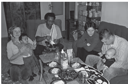
Familie Schmitz und Familie Ojok

Wir sind drei Geschwister. Ich, _____ Schwester Luisa und _____ Schwester Alexandra. Luisa reist gern. _____ Hobby ist aber teuer. Alexandra fährt gern Rad. _____ Fahrrad ist sehr modern. Wir wohnen alle bei den Eltern. _____ Eltern verstehen uns.